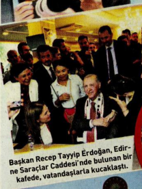
Başkan Recep Tayyip Erdoğan, Edirne Sarçalar Caddesi'nde bulunan bir kafede, vatandaşlarla kucaklaştı.

Başkan Erdoğan, Edirne'de 4 yıllık kapsamlı restorasyon sonrası ibadete açılan Selimiye Camii için yapılan törende konuştu: 450 milyon liraya mal olan restorasyonla Mimar Sinan'ın ustalık eserine 100 yıl daha kazandırdık